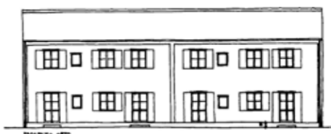
Disegno progettuale: Prospetto Mario Fiorentino architetto 48'-58'