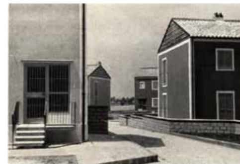
Casabella 212 1956, F.Gorio