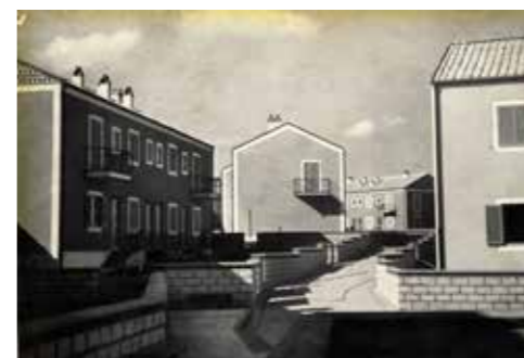
Casabella 212 1956, F.Gorio